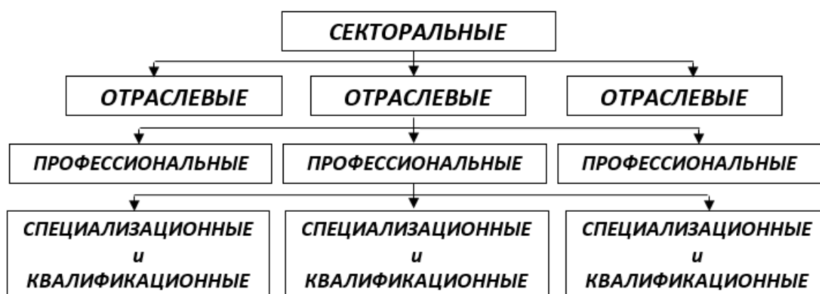
Рис.1. Структурные сдвиги на региональном рынке труда

Схематически виды определяемых с достаточной долей условности структурных сдвигов на региональном рынке труда представлены на рис.1.