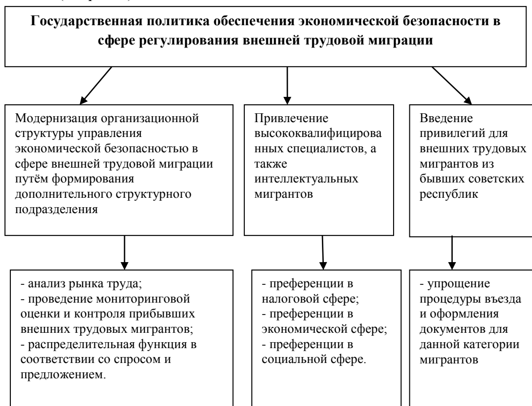
Рис.1 Основные направления совершенствования Государственной политики обеспечения экономической безопасности в сфере регулирования внешней трудовой миграции

Подводя итог вышесказанному, можно отметить, что совершенствование Государственной политики обеспечения экономической безопасности в сфере регулирования внешней трудовой миграции должно осуществляться в следующих направлениях (см. рис. 1).